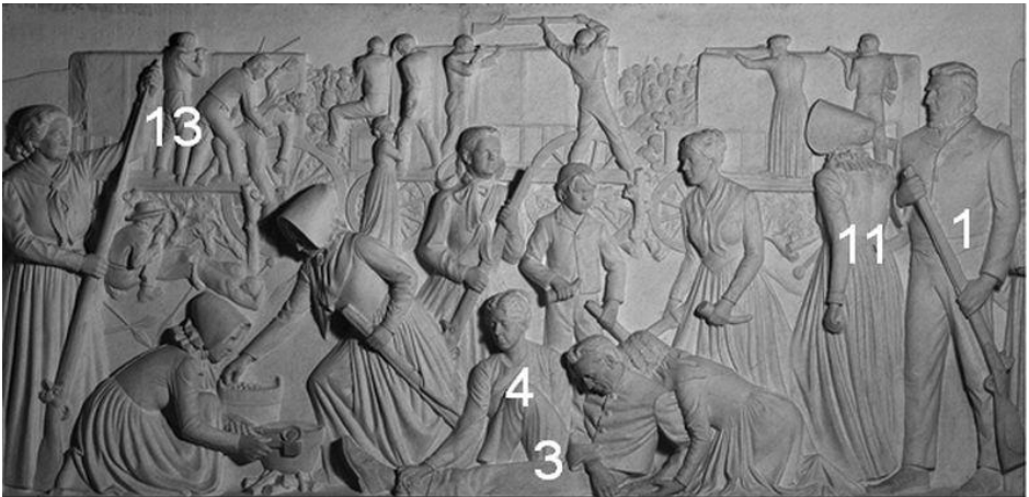
Die vyf figure wat die Henning Familiebond “gekoop” het en wat verderaan beskryf word

Na deeglike oorweging is daar besluit dat die Henning Familiebond vyf figure op paneel 5 kan bekostig. Paneel 5 beeld die Slag van Vegkop, 1836 uit. Hennie Potgieter was die beeldhouer van hierdie paneel.