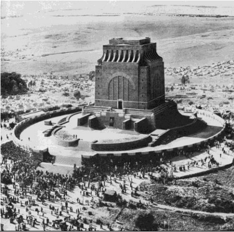
'n Lugfoto van die saamtrek om die monument tydens sy inwyding in Desember 1949, elf jaar nadat die hoeksteen in Desember 1938 gelê is.