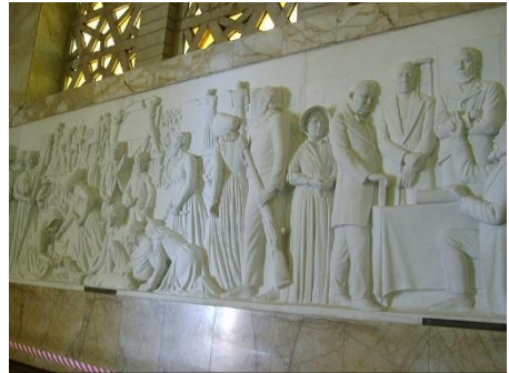
Paneel 5 – Vegkop aan linkerkant. Regs die inhuldiging van Retief as leier van die Voortrekkers

Silkaats het op Sondag 16 Oktober sy hele mag van sowat 6 000 gestuur om die boere aan te val. Omtrent 1/3 van hierdie mag was egter slawe, wat bloot saamgegaan het om beeste te buit en terug te jaag. Twee dae voor die slag is die boere deur Betsjoena-boesmans of Bataoeng gewaarsku dat die impi op pad was.