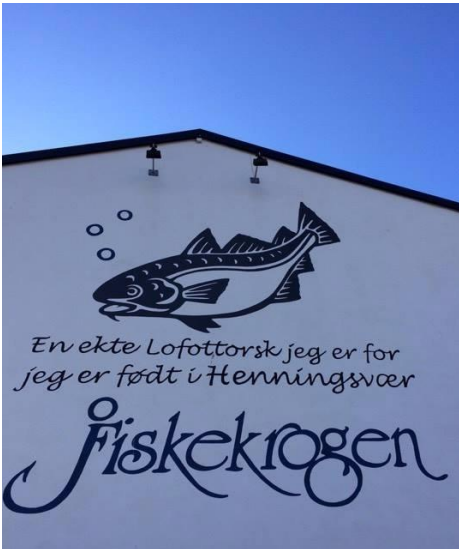
Die Fiskekrogen – Viskroeg – restaurant waar die heerlikste vissop voorgesit word. Mense kom van heinde en verre om hierdie heerlike sop te kom geniet