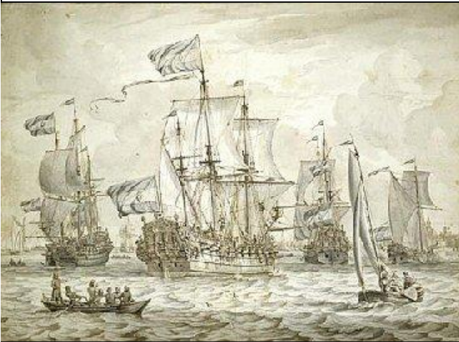
'n Vloot skepe maak gereed om vanaf die eiland Texel uit vaar na Batavia