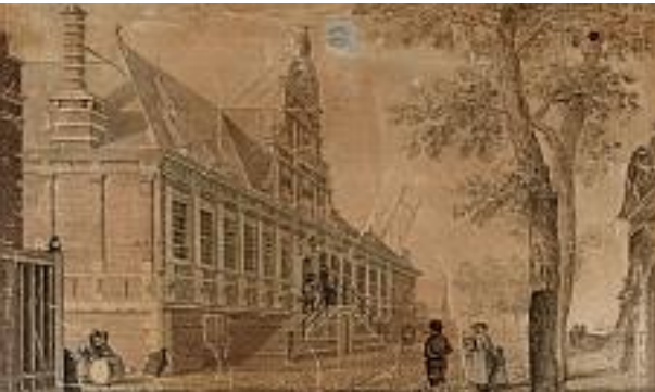
'n Tweede skildery van Het Oostindisch huis te Enkhuizen , die hoofkwartier van die kamer Enkhuizen. Dit toon die gebou net van die ander kant af as die skildery op die voorblad